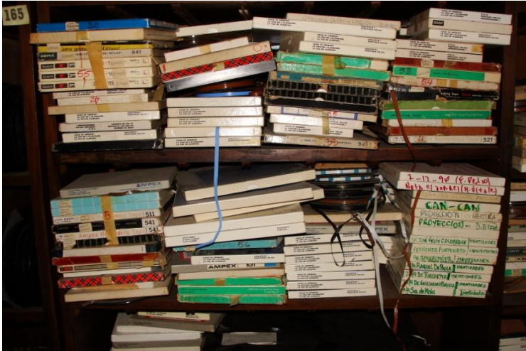
Fig. 1. Cintas almacenadas en la emisora.