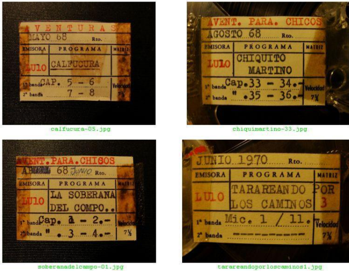
Fig. 2. Detalle de las etiquetas. Autor: Jorge Arabito.