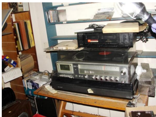
Fig. 3. Bandeja giradiscos de LU10. Autor: Jorge Arabito.

Dentro de las actividades iniciales, se realizó un reconocimiento visual exploratorio de la discoteca para identificar aquellos conjuntos de discos que estuvieran en mayor riesgo debido a la fragilidad de su material o de su estado precario a los fines de establecer prioridades de trabajo. Se llevó a cabo registro fotográfico y filmico de esta recorrida de visualización e identificación del material existente así como de las categorías estilísticas, rítmicas y epocales que eran utilizadas en la discoteca para el ordenamiento y ubicación de los discos.