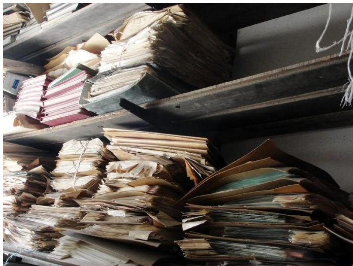
Fig. 5. Archivo gráfico de LU10. Autor: Jorge Arabito